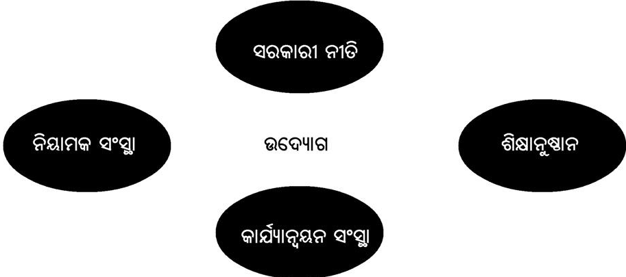
ଚିତ୍ର : ୧ : କୌଶଳ ବିକାଶ ପାଇଁ ଉଦ୍ୟୋଗଜଗତର କେନ୍ଦ୍ରୀୟ ଭୂମିକା ।

‘C’ ସଂପର୍କରେ ଅଭିଜ୍ଞ । ସେଗୁଡ଼ିକ ହେଉଛି Communication (ସଂଚାର), Collaboration (ସହଭାଗିତା), Creativity (ସୃଜନଶୀଳତା) ଏବଂ Critical Thinking (ବିଶ୍ଳେଷଣାତ୍ମକ ଚିନ୍ତନ) । ତେଣୁ, କୌଶଳ ବିକାଶର ପ୍ରତ୍ୟେକ କାର୍ଯ୍ୟକ୍ରମ, ଏହି ବିଷୟଗୁଡ଼ିକ ଉପରେ ଧ୍ୟାନ ଦେବା ଆବଶ୍ୟକ । ଯଦ୍ଵାରା